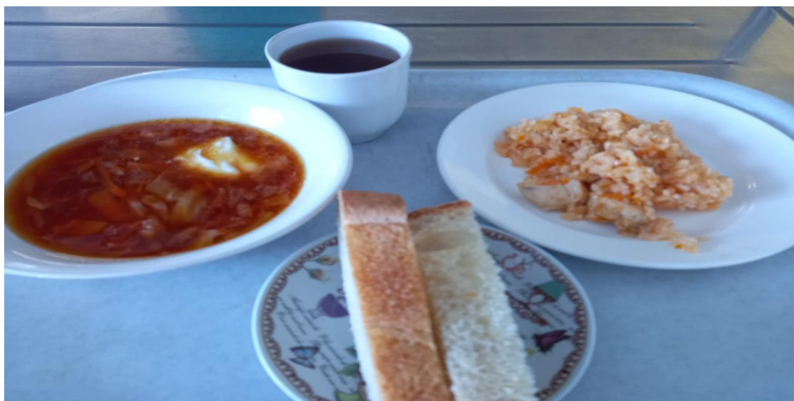
Обед (для обучающихся с ОВЗ 5-9 класс )