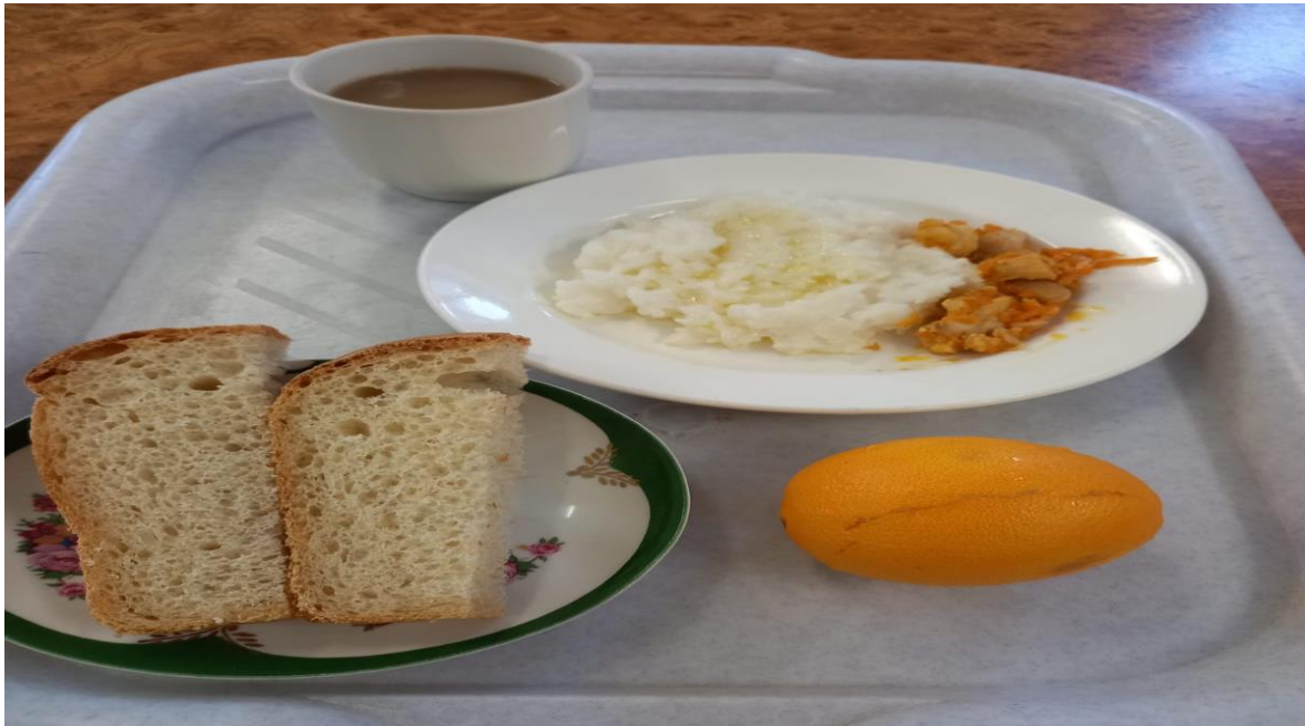
Завтрак (для обучающихся из многодетных малообеспеченных семей, для обучающихся начальных классов)